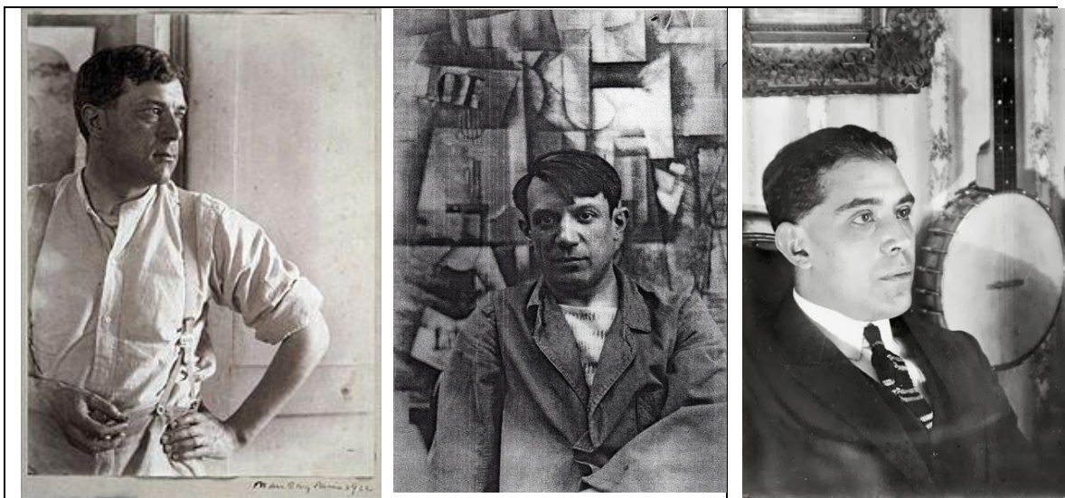
De izquierda a derecha Braque, Picasso y Gris

En sus primeros cuadros cubistas, como primer paso divide el lienzo con líneas horizontales, verticales y oblicuas con intervalos regulares, las oblicuas son diagonales de los cuadrados que se forman en las intercesiones.