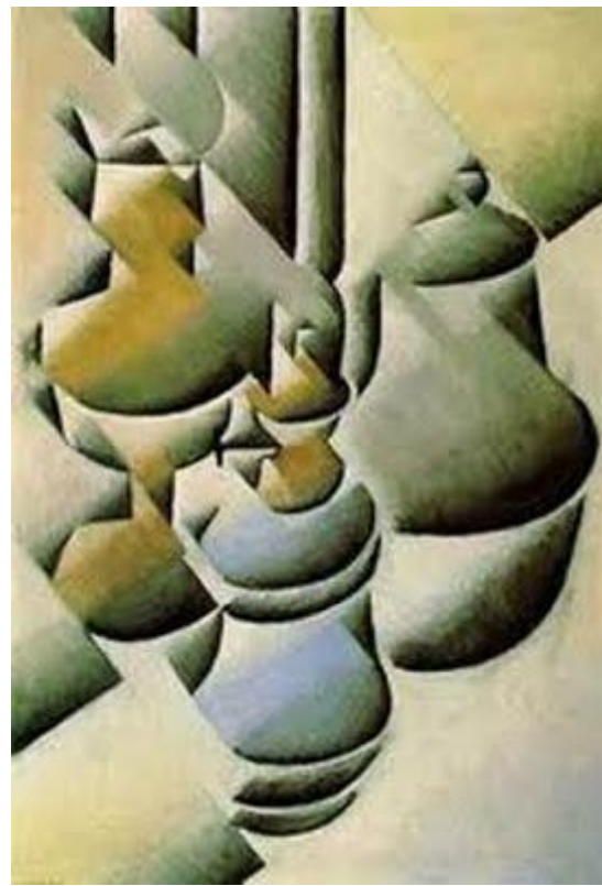
Bodegón obra de Juan Gris original

Luego acomodaba los objetos, o figuras que iba a representar a ese entramado, de tal forma que es este el que condiciona la forma de aquello que a pintar.