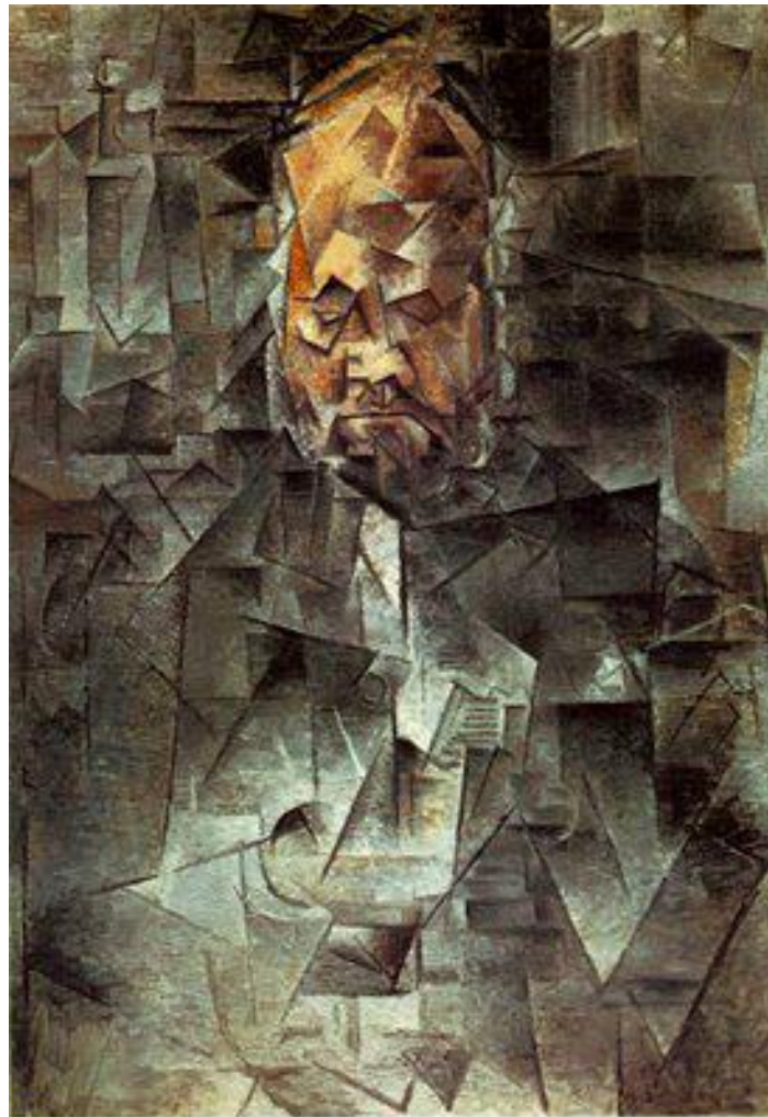
Retrato de Vollard obra de Picasso.

La creatividad es también una de las piedras angulares del aprendizaje. Cuando aprendes te enfrentas a lo nuevo.