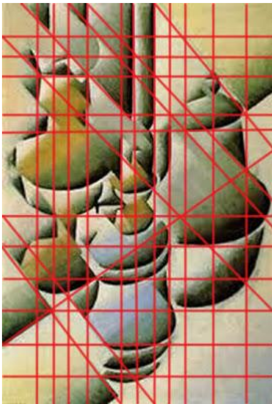
Bodegón obra de Juan Gris con la retícula compositiva marcada en rojo

En la siguiente imagen he marcado con líneas rojas parte de esa estructura previa sobre la que descansa la composición.