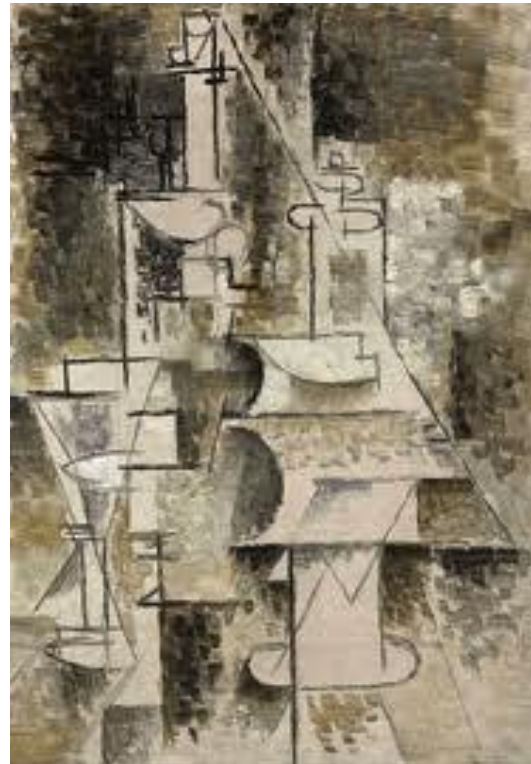
Le Portugais de Braque y bodegón de Picasso.

Ellos más que aplicar un método, experimentan siempre abiertos a nuevas posibilidades. En sí el reto de hacer algo nuevo es ya una motivación y el tema puede llegar a ser una excusa en donde investigar.